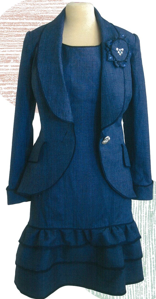
「本場結城紬」ワンピースとジャケット